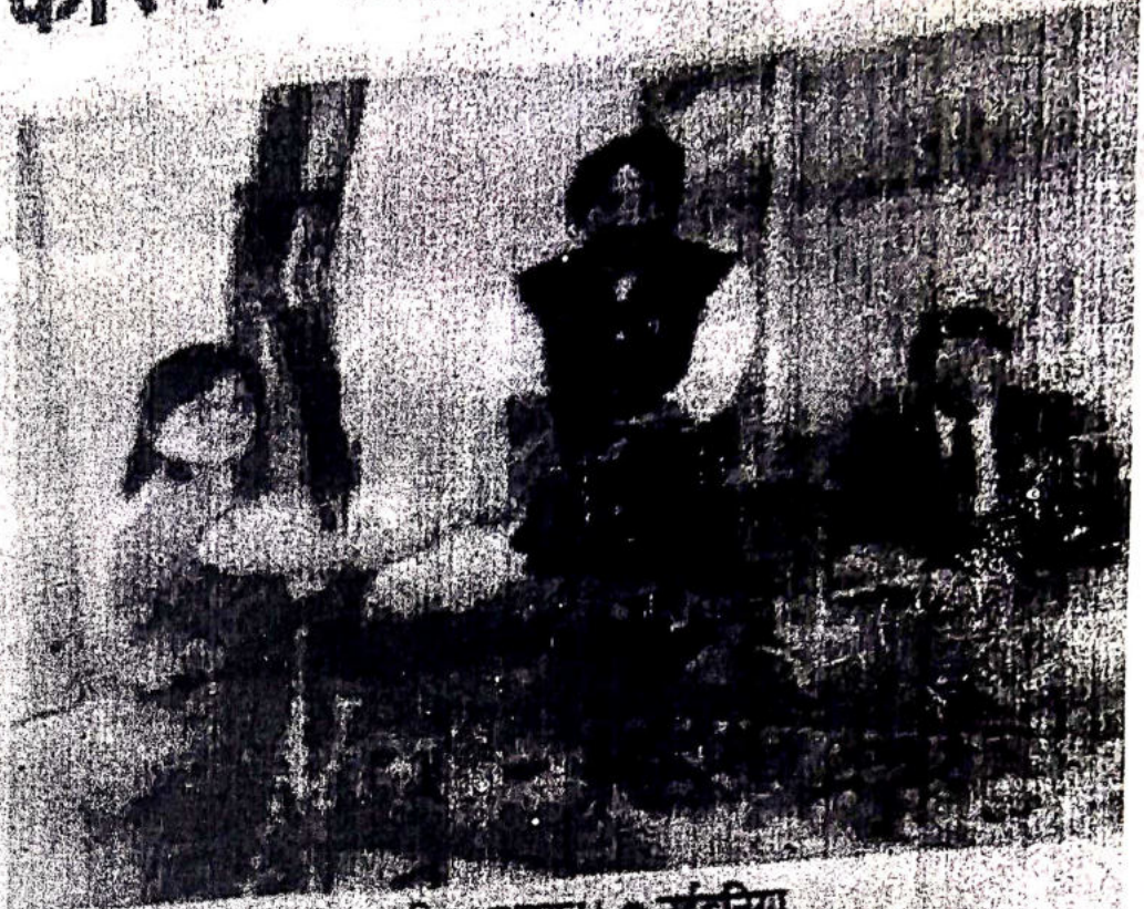
अतिथियों को गुलदस्ता भेंटकर किया सम्मान।