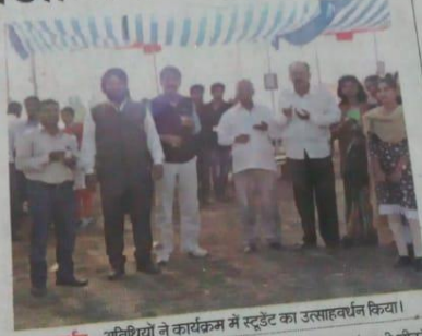
उत्साहवर्धन... अतिथियों ने कार्यक्रम में स्टूडेंट का उत्साहवर्धन किया।